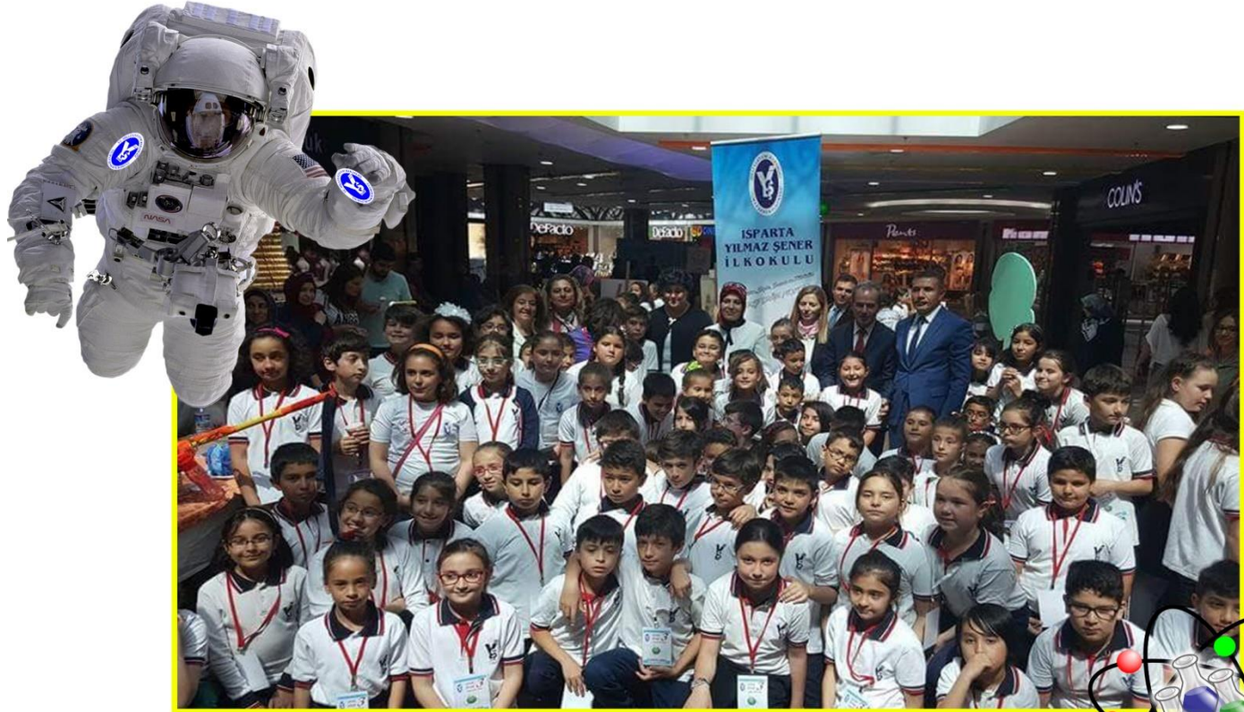
lyaş Avm “Ufuk Ötesi” hatıra fotoğrafı

Sergi sonunda tüm öğrencilerimiz madalya ile ödüllendirildi.